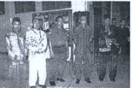
TAMU UNDANGAN DAN CIVITAS AKADEMIKA UMB: Lokakarya nasional dihadiri tamu dari FKPD, kolega serta keluarga besar civitas akademika UMB.